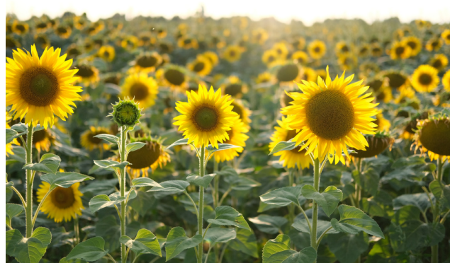
Solrosor i Ukraina